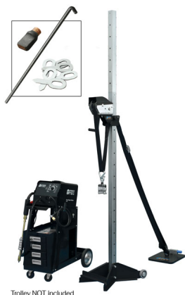
Trolley NOT Included